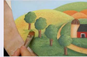
31. באזורים שמתחת לעצים, יוצרים הצללות בצבע ירוק בהיר.