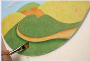
14. מצלילים את האזור שמתחת לשביל בצבע ירוק כהה.