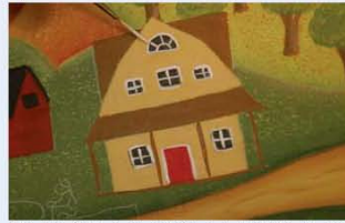
25. תוחמים את החלונות ואת הדלתות של הבית, בעזרת מכחול ליינר המוטען בצבע לבן.