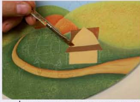
18. צובעים את הבית בצבע מייפל ואת הגג צובעים בצבע חום. לאחר מכן, מצלילים את צידו השמאלי של הגג בשחור.