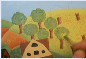
23. את צמרות העצים, צובעים בצבע ירוק.