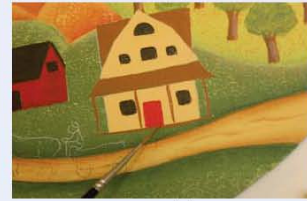
24. בעזרת מכחול ליינר המוטען בצבע חום, יוצרים את קורות העץ שמופיעות בחלקו הקדמי של הבית.