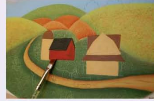
19. את האסם, צובעים באדום ואת הגג צובעים בשחור ואת ה"סילו" (הגליל הגבוה שמשמש לאיסון תבואה), צובעים בצבע מייפל ואת הגג של ה"סילו" צובעים בצבע חום.