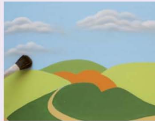
8. יוצרים את העננים. על ידי תיפופים של המכחול ולאחר מכן, מרככים את העננים בעזרת משיכות של מכחול "מופ" (כפי שמוזגם בתמונה).