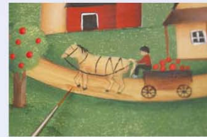
34. יוצרים הצללה חומה, באזור שמתחת לסוס.