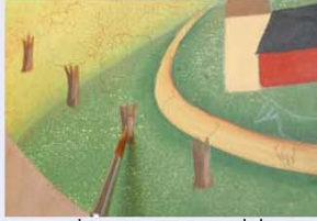
20. את הגזעים של עצי התפוחים, צובעים בחום ומצלילים את צידם השמאלי בערבוב של חום ושחור. בצידם הימני של הגזעים יוצרים הבהרות בעזרת צבע בגוון מייפל.