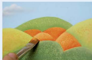
16. מבהירים בעזרת מכחול אלכסוני המוטען בצבע בגוון מייפל מעורבב עם לבן, את הקוים המחברים בין הגבעות הכתומות.