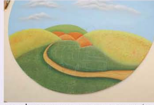
17. לאחר שסיימתם ליצור את ציור הגוף (הבסיס), מעתיקים בעזרת נייר העתקה לבן את האיור עם הסוס, האסם והעצים.