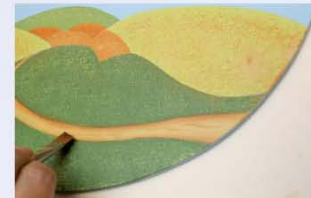
13. מצלילים את השביל, בשני צידיו בעזרת מכחול אלכסוני המוטען בטעינת צד בצבע חום ולאחר מכן, מוסיפים קווי הצללה חומים נוספים.