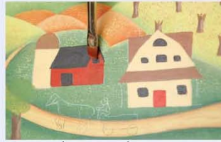
22. צובעים את החלונות ואת הדלתות בשחור או באדום (כפי שמופיע בתמונה).