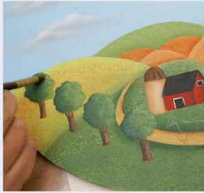
30. צובעים את צמרות העצים, כשהצבע הכהה יותר יצבע את צידם השמאלי של העצים והירוק הבהיר יצבע את צידם הימני.