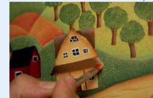
27. מבהירים את חלקו העליון של גג הבית ואת הפרגולה שבחלקו הקדמי של הבית.