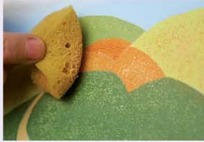
21. על גבעות מספר 6+7, מתופפים בעזרת ספוג המוטען בצבע בגוון מייפל.