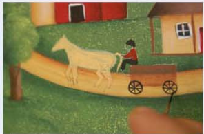
33. צובעים את העגלה, הגלגלים של העגלה ואת פניו וידיו של האיכר אשר יושב על העגלה, צובעים בצבע גוף (המורכב מערבוב של אדום-לבן ומעט גוון מייפל).