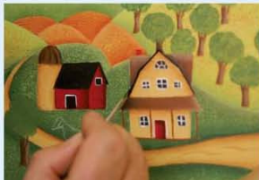
28. תוחמים את חלקו העליון של גג הבית, בעזרת מכחול ליינר מוטען בצבע שחור.