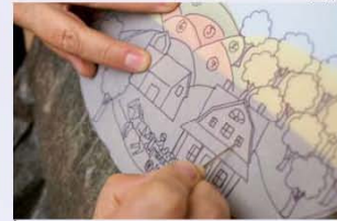
21. מעתיקים בעזרת מנקד, את הפרטים של הבית והאסם (חלונות דלתות וכו').