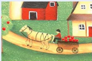
36. כמו כן, מוסיפים מספר תפוחים על העגלה.