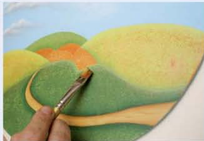
15. את גבעה מספר 3 מצלילים בחלקה התחתון. בעזרת צבע ירוק כהה יותר ומבהירים את החלק העליון. בעזרת צבע ירוק בהיר.