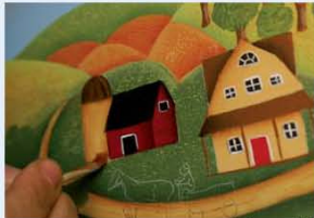
26. מצלילים את פינות הבית והאסם בצבע חום.