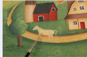
32. צובעים את הסוס בעזרת מכחול ליינר וצבע מייפל ויוצרים הצללה חומה באזור התחתון של הצוואר, בחלק התחתון של הבטן ובקצוות הרגליים.