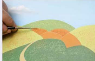
בגבעות מספר 4-5, מציירים קווים בעזרת מכחול ליינר המוטען בצבע כתום אדמדם.