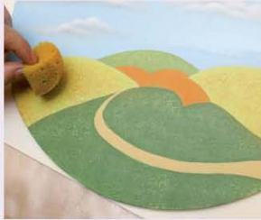
9. מטעינים את הספוג במעט צבע כתום וצובעים בעזרתו (בתיפוף) את הגבעות הצבועות בצבע ירוק בהיר.