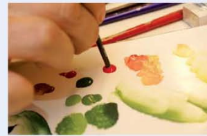
35. ליצירת התפוחים שעל העצים, טובלים את צידו האחורי של המכחול בצבע אדום ובעזרתו מנקדים את העצים.